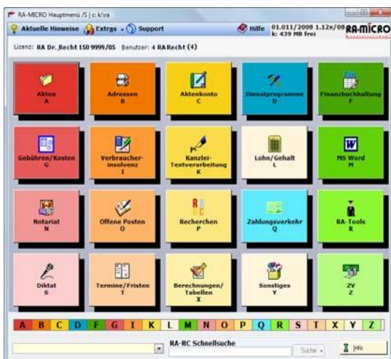
Das RA-MICRO Kachelmenü

Das „Kachelmenü“ ermöglicht den Schnellaufwurf von Programmen mit nur einem Tastendruck und von Programmfunktionen mit einem weiteren Tastenanschlag.