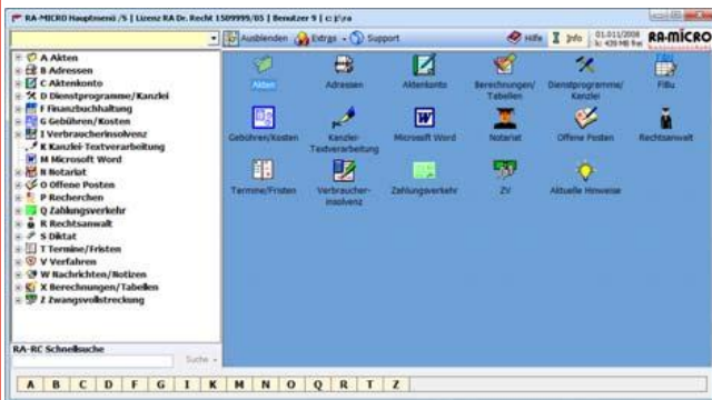
Der RA-MICRO Personal Desktop

Per „Drag & Drop“ können Programmfunktionen aus dem „Programmbaum“ links in den rechten Bereich des „Personal Desktops“, den „Programmdesk“, gezogen werden. Häufig genutzte Programmfunktionen können so individuell im Programmdesk zusammengestellt werden.