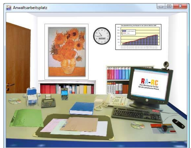
Der RA-MICRO Anwaltsarbeitsplatz

Der „Anwaltsarbeitsplatz“ ermöglicht dem anwaltlichen Nutzer eine intuitive Bedienung.